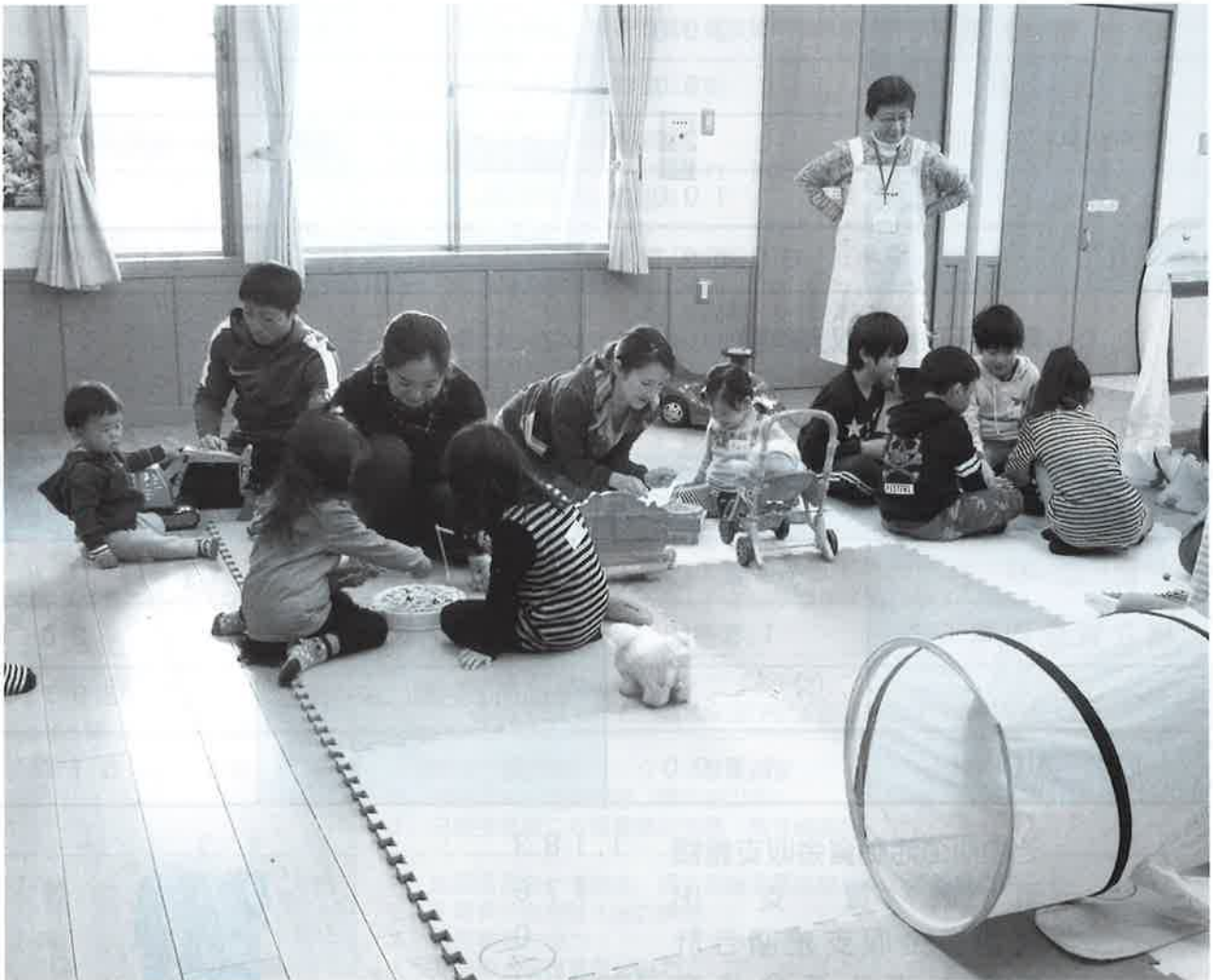
「おもちゃ図書館夢ぽけっと風景」こども館にて

社会福祉法人 勝浦市社会福祉協議会(保健福祉センター内) 〒299-5226 千葉県勝浦市串浜1191番地の1 ☎(0470)73-6101 FAX(0470)73-6102