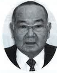
勝浦市社会福祉協議会