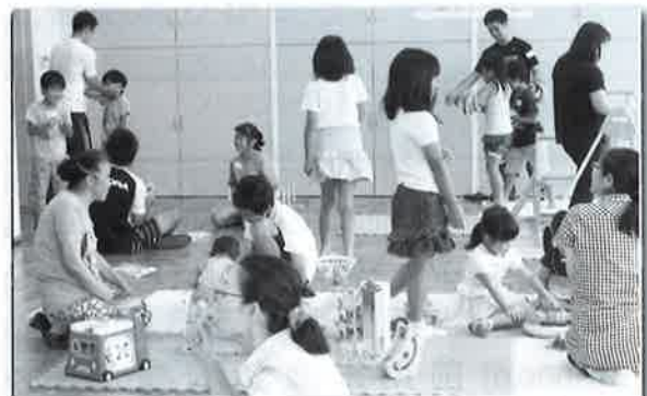
「おもちゃ図書館夢ぼけっと交流サロン風景」会場：保健福祉センターにて