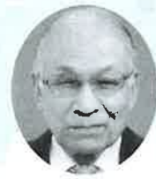
勝浦市社会福祉協議会