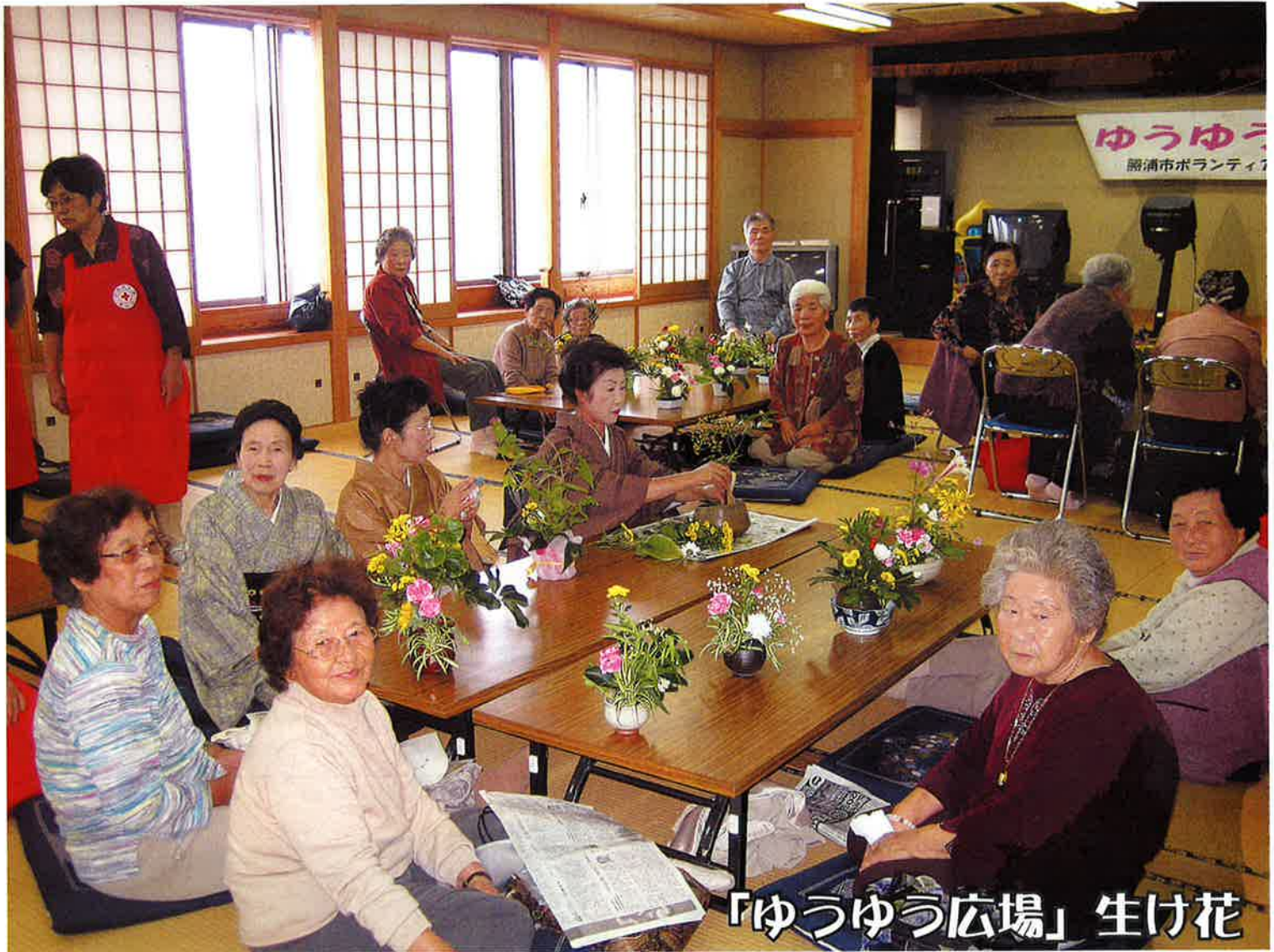
「ゆうゆう広場」生け花

ボランティアが活動の拠点としているボランティアセンターは勝浦市社会福祉協議会の中にあります。活動に関する相談・広報・啓発・情報提供などを行い、地域の人々が助け合い、安心して暮らせる事を目的としています。