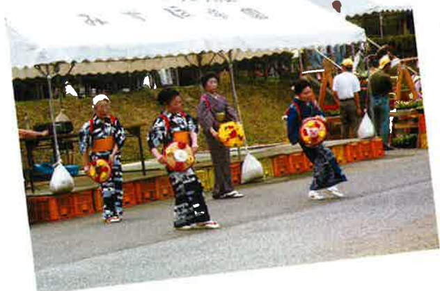
第18回みずほ祭りの様子 H21.5.31(日)