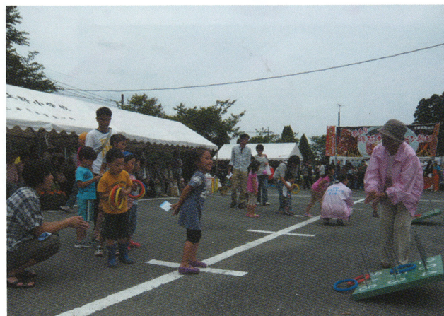
輪投げ(みずほ祭り)

多様な団体が登録しているボラ連には、福祉施設からの誕生会やイベント等でのアトラクション依頼も多数あり、お互いが楽しめるように心がけています。また、みずほ学園の方が地域の皆さんと交流を深めるために行なっている【みずほ祭り】でも踊りやゲームなどの協力をしています。