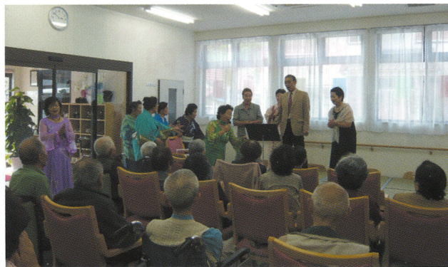
施設訪問（アンダンテ勝浦）