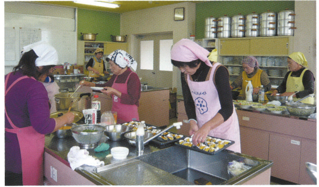
ゆうゆう広場 昼食準備(保健福祉センター)

多様な団体が登録しているボラ連には、福祉施設からの誕生会やイベント等でのアトラクション依頼も多数あり、お互いが楽しめるように心がけています。また、みずほ学園の方が地域の皆さんと交流を深めるために行なっている【みずほ祭り】でも踊りやゲームなどの協力をしています。