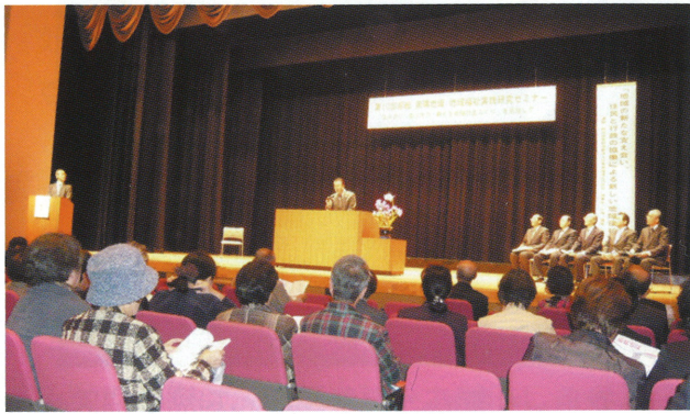
第10回房総地域福祉実践研究セミナー

【ボラ連】とは・・・ボランティアセンターに登録している方（団体）が加入できる情報交換の会です。ボラ連では、各団体（個人）が自分たちの特技・特色を活かし個々の活動の他、ボランティアセンターの主催する様々な行事に協力をしたりボランティア同士の交流を図ったりしています。そして様々な依頼に対応出来るよう、自己啓発のために研修会にも参加しています。