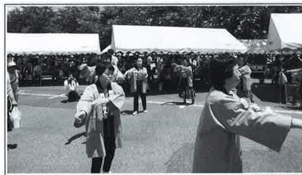
【勝浦市婦人会による踊り】