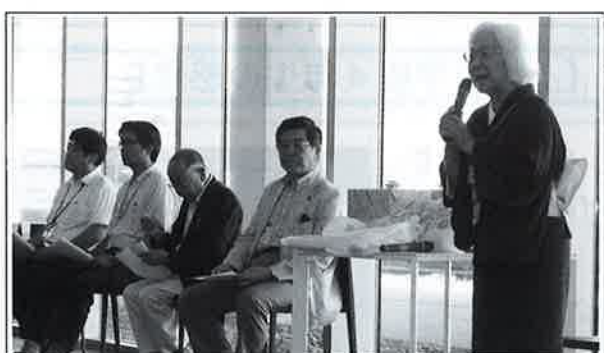
【ボラ連 関野会長挨拶】