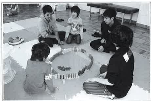
【勝浦市保健福祉センターにて】