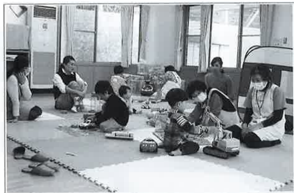
【勝浦市こども館にて】