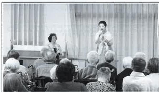
【あゆみ会によるカラオケ】