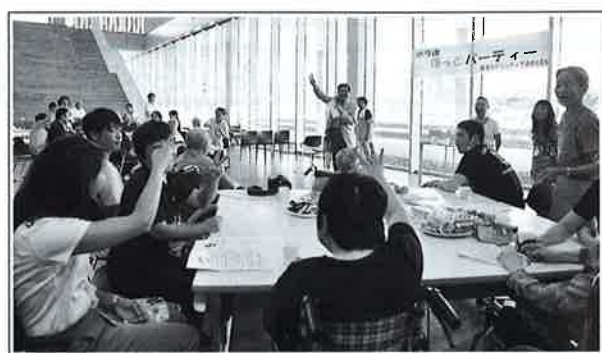
【市長とじゃんけん大会】