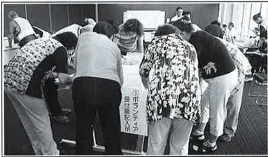
【ボランティアセンター立ち上げ模擬訓練】(前年度 キュステにて)